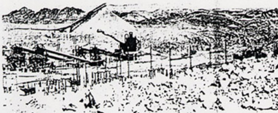
De Rössing uraniummijn nabij Swakopmund.

vanaf de Sluis van de verrijking van Namibië www.kairos.org handen voren was de parlementaire oppositie